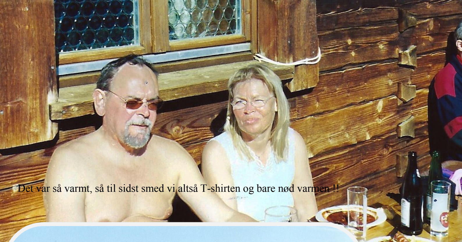
Det var så varmt, så til sidst smed vi altså T-shirten og bare nød varmen !!